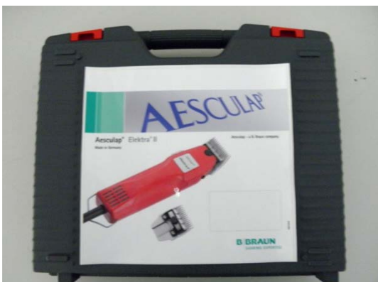
GT105819 Koffer und TA013379 Aufkleber