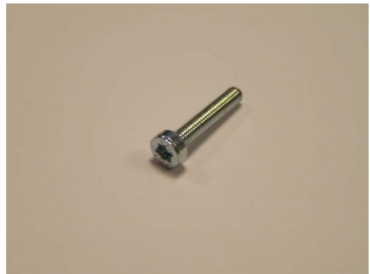
TA013499 Torxschraube M3x16