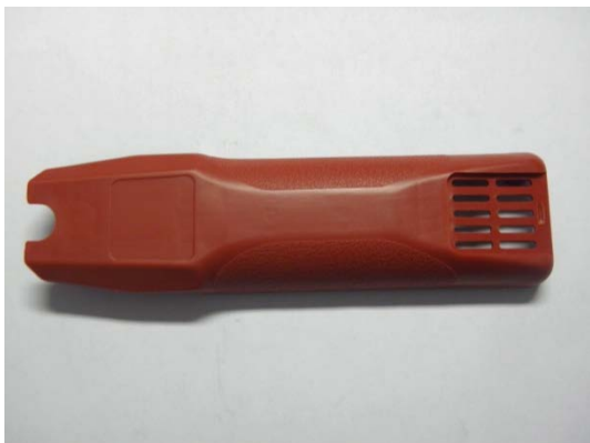
GT104802 Gehäuse oben