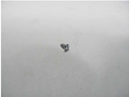
TA004627 Blechschraube 6,5 mm lang