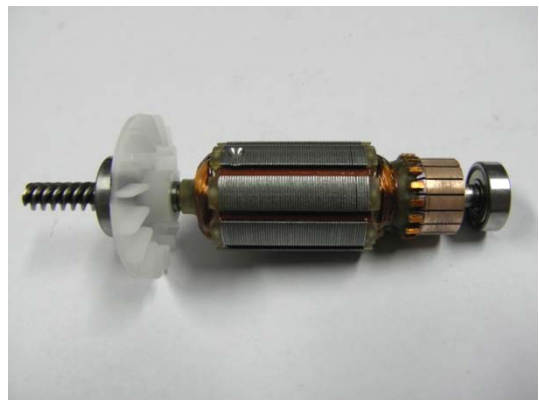
GT104865 Anker verpackt