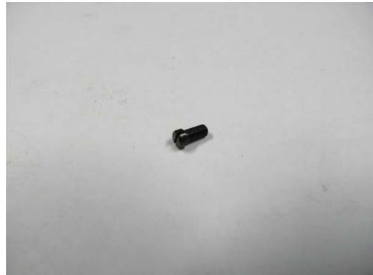
TA004639 Flachkopfschraube M3 x 6