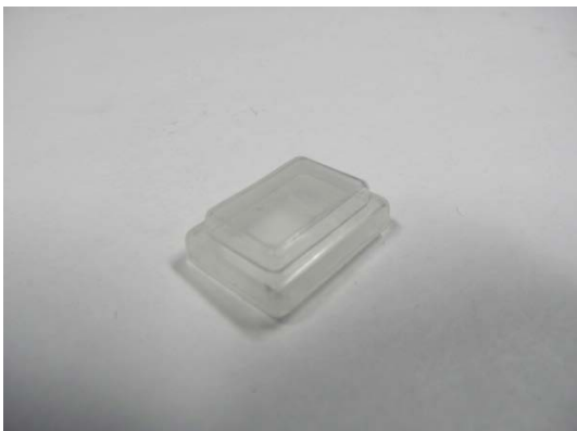
GT104249 Dichthaube für Schalter