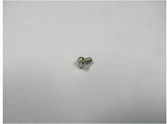
TA004663 Zylinderschraube M3 x 5,5