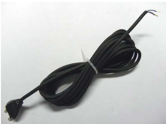
TA013520 Kabel 5m