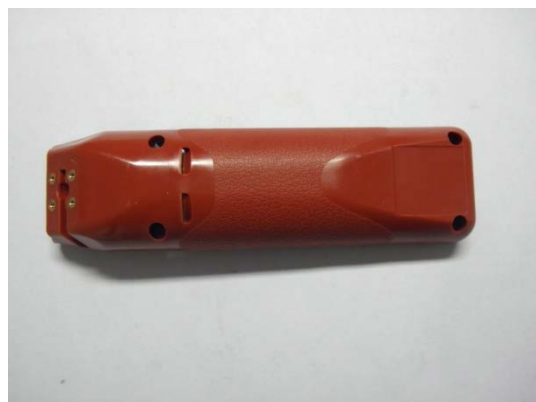
GT104801 Gehäuse unten