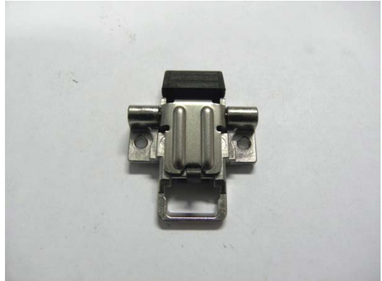
GT105415 Messerscharnier komplett