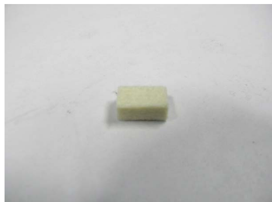
GT300224 Ölfilz 12x9