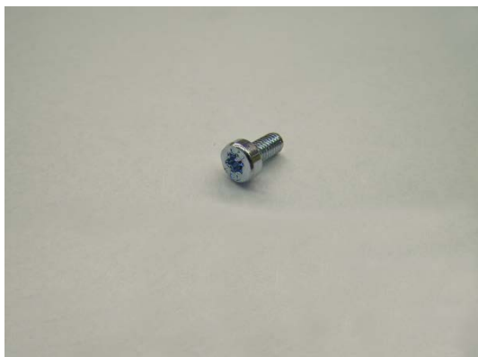
TA013517 Torxschraube M3x5,5