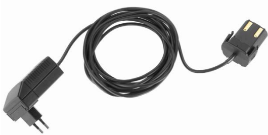
GT207 Adapter inkl. Netzteil + Stecker UK ( gelb ), USA/Japan ( blau ), Australien ( rot )