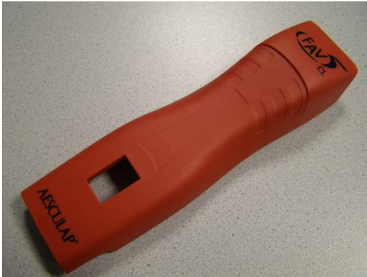
GT300802 Gehäuse oben