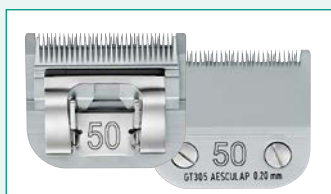
GT305 (#50) 1/125" | 0,2 mm