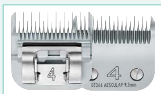
GT366 (#4) 3/8" | 9,5 mm