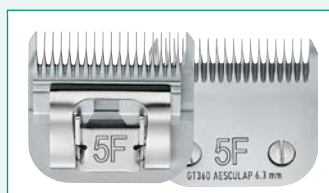
GT360 (#5F) 1/4" | 6,3 mm