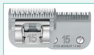
GT326 (#15) 3/64" | 1,2 mm