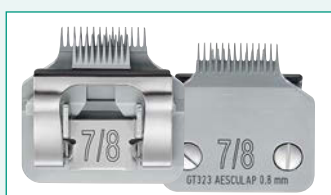
GT323 (#7/8) 1/32" | 0,8 mm