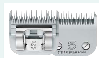
GT357 (#5) 1/4" | 6,3 mm