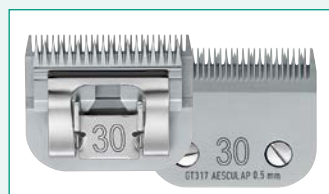
GT317 (#30) 1/50" | 0,5 mm