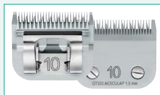
GT330 (#10) 1/16" | 1,5 mm