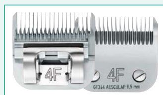
GT364 (#4F) 3/8" | 9,5 mm