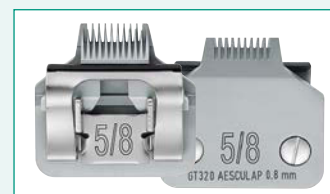
GT320 (#5/8) 1/32" | 0,8 mm