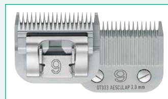
GT333 (#9) 5/64" | 2,0 mm