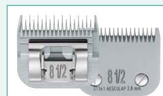
GT341 (#8 1/2) 7/64" | 2,8 mm