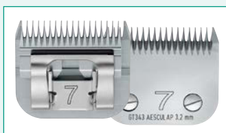
GT343 (#7) 1/8" | 3,2 mm