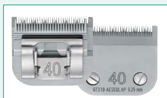
GT310 (#40) 1/100" | 0,25 mm